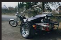
Firmengründung Foundation Création de la société.