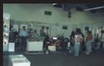
IAA - Der BOOM beginnt IAA - The BOOM begins IAA - Le BOOM commence