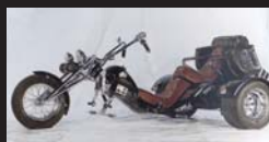
Serienproduktion Low Rider Serial production Low Rider Production en série Low Rider