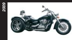
Moto-Trikes Shadow 750