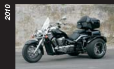
Moto-Trikes Intruder 1800